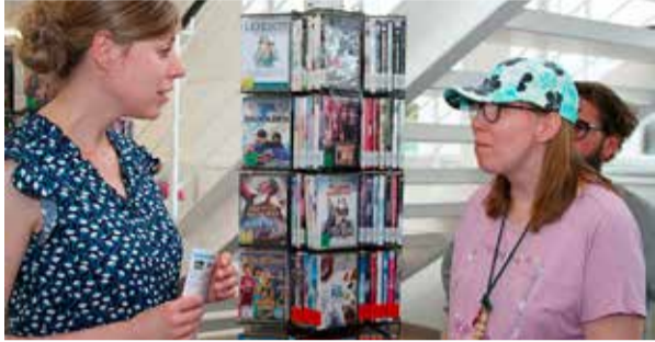
Eigenständig in die Bücherei gehen ...

Diakonie und Kirche gestalten inklusive Nachbarschaften