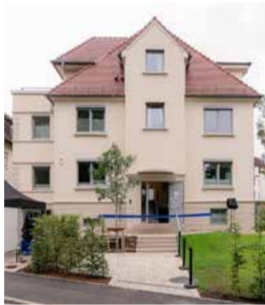
Das Frauen- und Kinderschutzhause der Diakonie Heilbronn, das „Open House“.