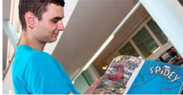
... und ein Comic-Heft ausleihen.