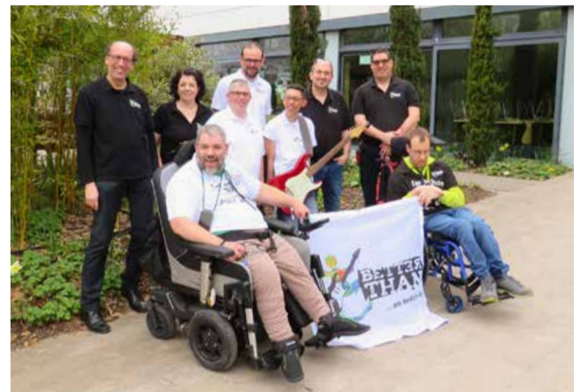
Die aktuelle Besetzung von „Better Than“ blickt auf ein Jubiläumsjahr mit vielen Auftritten zurück.